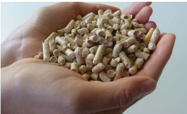
Pellets, ein kompakter, emissionsarmer Brennstoff

presst. Das Resultat ist ein nach verbindlicher Produktnorm hergestellter, kompakter Brennstoff mit hohem Heizwert. Höchste Brennstoffqualität bieten Pellets mit Qualitätszertifikat ENplus® A1. Unter den Holzbrennstoffen weisen Pellets den höchsten Energieinhalt pro Kubikmeter auf, was die Anzahl Brennstofflieferungen und die notwendige Silogrösse reduziert. Der Energieaufwand zur Produktion und Bereitstellung von Pellets ist deutlich niedriger als bei fossilen Energieträgern. Der Pelletpreis hat über die letzten Jahre nur kleine Schwankungen erfahren und bewegt sich stets zwischen 7 und 9 Rp./kWh, abhängig von Transportweg und Liefermenge. Aktuelle Informationen zum Pelletpreis finden Sie auf www.propellets.ch .