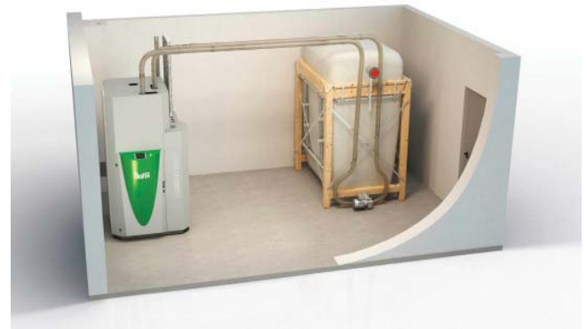
Skizze Pelletheizkessel, Brennstoffzuführung, Gewebetank als Pelletlager

Pelletfeuerungen zeichnen sich durch niedrige Emissionen und hohe Wirkungsgrade aus, denn der Brennstoff ist homogen und lässt sich einfach und kontrolliert verbrennen. Die Feuerungsleistung ist zwischen 30 und 100 Prozent stufenlos regulierbar. Die Heizungen sind in verschiedenen Leistungsklassen erhältlich: von der kleinen Wohnraumheizung bis zum grossen Zentralheizungskessel. Auf dem Markt sind auch Kombikessel Pellets/Stückholz oder Pellets/Schnitzel erhältlich.