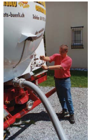
Anlieferung mit Tanklastwagen

luft wird der Brennstoff über einen Schlauch ins Silo gepumpt. Dazu sind an der Hauswand zwei normierte Öffnungen nötig: ein Schlauchanschluss und eine Entlüftung. Wird der Brennstoff im zu beheizenden Gebäude gelagert, haben sich dafür drei Systeme gut bewährt: Schrägbodenlager, Textil- oder Metallsilo. Es wird empfohlen, den Zugang zum Pelletlager mit den bei proPellets.ch bestellbaren selbstklebenden Hinweisschildern „HOLZPELLET-LAGERRAUM“ zu kennzeichnen. Pellets können auch in einem im Garten vergrabenen Erdtank gelagert werden. Nützliche Hinweise für die Planung des Lagerraums und die Lagerung der Pellets finden sich in der Broschüre „Lagerung von Holzpellets“, welche im Shop von proPellets.ch als Download zur Verfügung steht. Bei der Planung des Lagers sind UNBEDINGT die Richtlinien der Vereinigung kantonaler Feuerversicherungen VKF zu beachten. Es empfiehlt sich zudem, einen Brennstofflieferanten in die Planung einzubeziehen. Dieser kann wertvolle Inputs zur Zufahrt und Lagerauslegung geben.